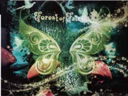
フラッシュ撮影時