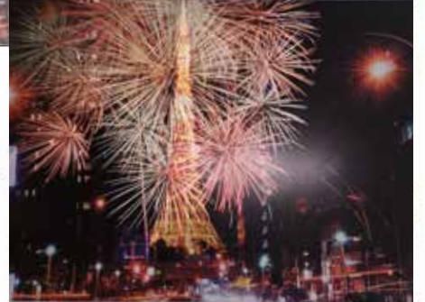
フラッシュ撮影時